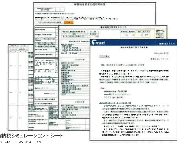
連結納税シミュレーション・シート 及びレポートのイメージ