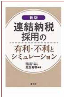
10. アイキャッチ画像